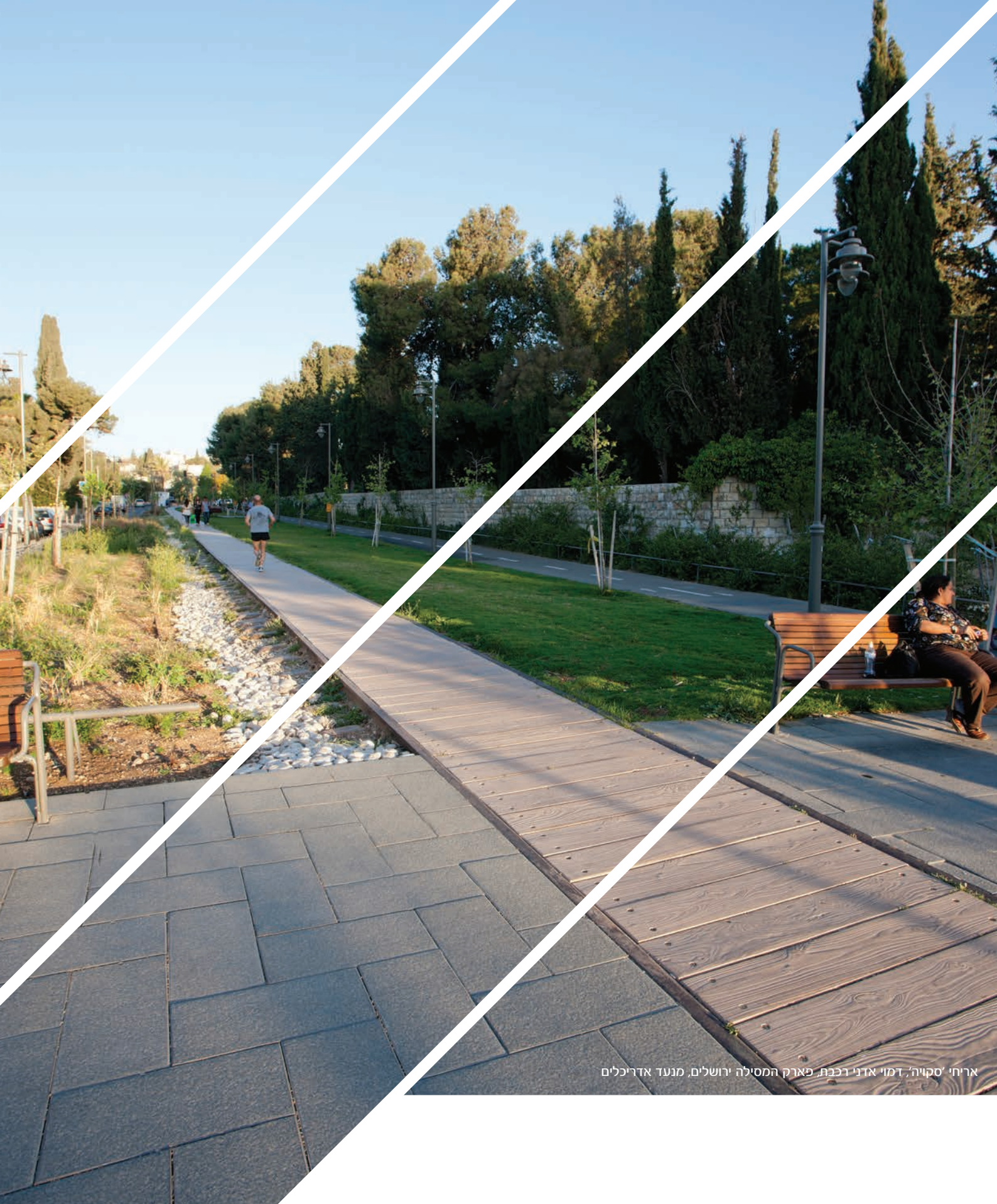
אריחי 'סקויה' דמוי אדני רכבת, פארק המסילה ירושלים, מנעד אדריכלים