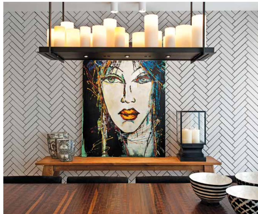
חיפוי לבני סיליקט מנוסר דגם 'לבנה צרה'. בית פרטי תל אביב אושרי אבירם ודנה קושמירסקי, עיצוב פנים

מקור לגאווה: חברת 'אקרשטיין' מעסיקה במשך עשרות שנים מאות עובדים השוקדים על פיתוח מוצרים חדישים ופתרונות מתקדמים, כולם 'כחול-לבן'. מהמפעלים שנמצאים בירוחם שבדרום, באשדוד שבמרכז ובראש פינה שבצפון, משווקת החברה את מוצריה לכל הארץ ואף מייצאת לארצות אחרות מוצרים באיכות הגבוהה ביותר, תוך עמידה קפדנית בתקנים המחמירים ביותר. חברת 'אקרשטיין' הונדעת בתחומי הבנייה הציבורית והמסחרית הרחיבה לאחרונה את פעילותה גם לקהל הפרטי, כדי להביא לכל בית ובית את היכולות האין-סופיות, את הניסיון העשיר ואת הפתרונות החדישים והמתקדמים הכוללים גם הכוונה וייעוץ. מגמה זו מטרתה לאפשר לקהל הפרטי להגשים כל חלום עיצובי בתוך הבית ומחוצה לו. הפתרונות העיצוביים של חברת 'אקרשטיין' כוללים מגוון רחב של מוצרים, החל בלבני הסיליקט, דרך הבטון האדריכלי וכלה באריחים לעיצוב הגינה - קולקציות אופנתיות ועדכניות, והכול תחת קורת גג אחת. לבני סיליקט: 'אקרשטיין' הנה החברה היחידה בישראל המייצרת אבני 'סיליקט', הטרנד החם ביותר בתחום עיצוב הבית בארץ ובעולם. לבני הסיליקט בתצורות רבות מעניקות לבית אווירה ומדגישות את הסגנון העיצובי הנבחר על סוגיו, מכפרי ועד מודרני. לאחרונה התחדשה 'אקרשטיין' במוצרים ייחודיים - לבני סיליקט בצורת סטריפים לחיפוי קירות פנים וחוץ, המעניקות מראה מודרני ונקי לבית, ולבנים בגודל של בלוקים לחיפוי קירות ולבניית גדרות וקירות דקורטיביים. עמידותן של לבני הסיליקט בכל תנאי מזג האוויר והתיישנותה הנהדרת הפכו את אבן הסיליקט לשחקן אהוד ומקובל מאוד בנוף הגינות בישראל.