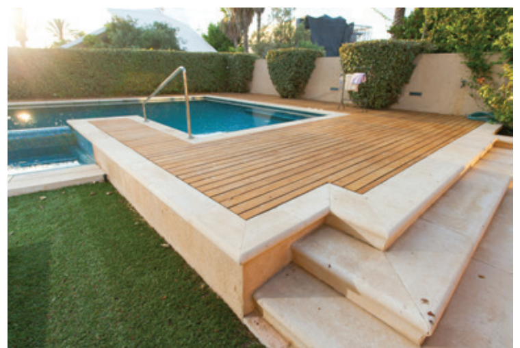
מדגת פארק מעוגלת וקופינג תואם מבטון אדריכלי - אדריכלות: קימל אשכולות

ההיצע הקיים היום בתחום ה- OUTDOOR LIVING כולל במקום אחד את כל האלמנטים שאיתם ניתן ליצור, בתכנון נכון, מראה אחיד ומרשים בכל המרחב סביב הבית, ומתחבר נכון עם הפנים. מעבר לריצוף הבסיסי וחיפוי הקירות שנבחרו בהתאמה, משולבים במראה החיצוני עמודי הפרגולה, מדרגות, תוחמי צמחייה ספי בריכות ורעפים המשלימים את מראה הבית. לאלה נוספו רהיטים מעוצבים ומיוצרים מבטון, חומר שעל עמידותו בכל תנאי מזג האוויר כל מילה מיותרת. בפיתוח המוצרים של 'אקרשטיין HOME' הושם דגש מיוחד על ייצור מוצרי בטון במגוון רחב של צבעים ומרקמים שעוצבו במיוחד בקונסוליה לצמחייה בגינות פרטיות וציבוריות. גוני המוצרים והמרקמים מתאימים כאמור בכל אחד מסוגי סגנונות. שילוב אלמנטים דוממים בגינה, מעוצבים ועשויים מבטון, מוסיפים את היופי לגינה, החל מיום הקמתה ולמשך שנים ארוכות. ■