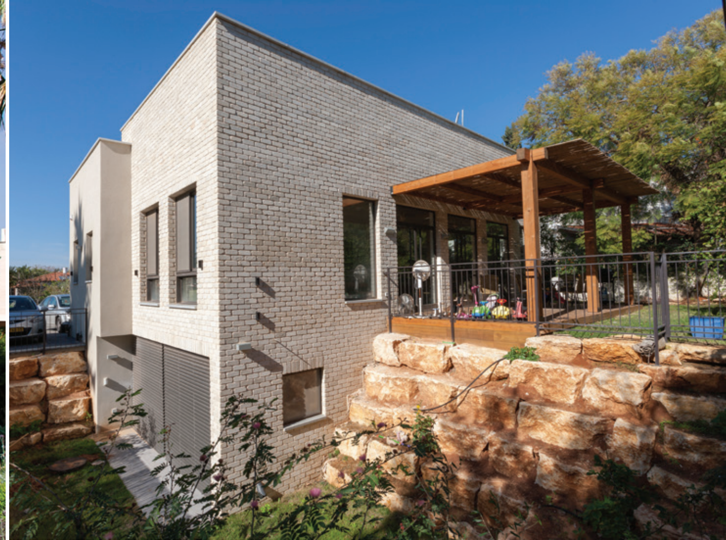
בריקים סיליקט, גימור מיושן קוקטיל צהוב- אדריכל: זוהר יושפה

חיזוק משמעותי להלך הרוח העכשווי המחיב תכנון ועיצוב סביבת הבית במלוא תשומת הלב, קיבלתי כאשר הזדמן לי לבקר במתחם תצוגה גדול, מחולק ליחידים חיצוניים מעוצבים בסגנונות שונים. בכל אחד מהסגנונות שהוצגו במתחם בלט החיבור האופטימלי בין כל מרכיבי העיצוב, כאשר הדגש העיקרי הושם על הריצוף שמהווה למעשה בסיס, תרתי משמע, לכל שאר האלמנטים המותאמים לו. בין הסממנים באדריכלות העכשווית בולטים שני דברים שנוצרו עקב תרבות החיים שהתפתחה כאן ובעולם בשנים האחרונות, והם: הפתיחות והשקיפות. קירות זכוכית שמהווים חזית שלמה, בעיקר חזית אחורית הפונה אל הגינה, ויציאות מרווחות הממוקמות בנוסף לסלון גם ברוב חדרי הבית. יוצא מכך שעיצוב סביבת הבית הפך לחלק בלתי נפרד מעיצוב הפנים. סגנון החיים העכשווי נרקם, התבסס וקיבל משמעותיות רבות בזכות הצרכים אשר השתנו עם הזמן. הגינה הפכה להיות מקום לבילוי ולהנאה רוב ימות השנה, ובשל כך, בבתים הנבנים בשנים האחרונות, תכנון הגינה נעשה במקביל לתכנון הבית, דבר המאפשר חיבור בין סגנונות ויצירת הרמוניה מושלמת בין הפנים לחוץ. הגינות הפרטיות היום מחולקות לפינות ייעודיות, מקום מוגדר לארוחות, מערכות ישיבה למטרות