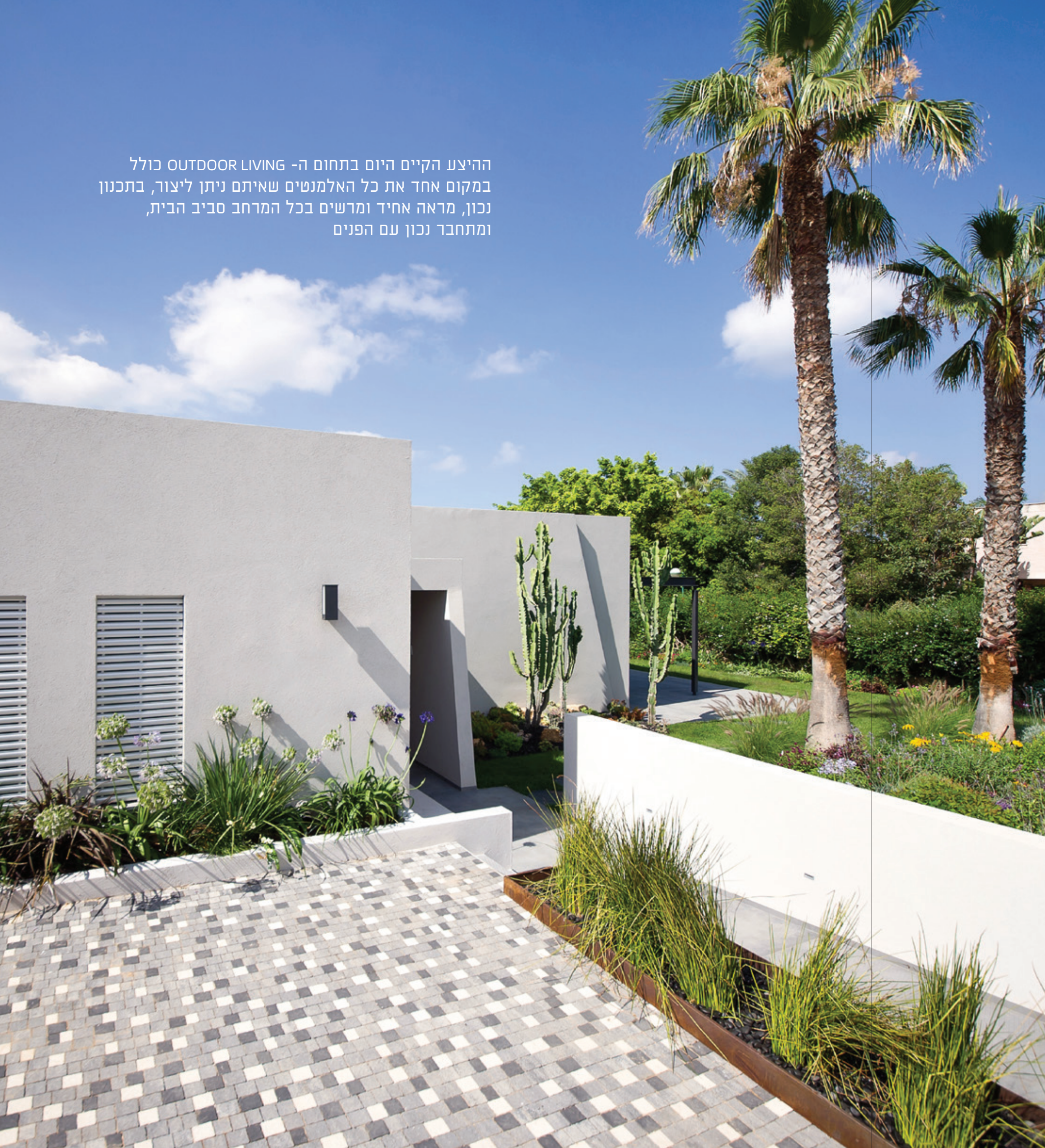
ריצוף דגם רמות בשילוב צבעים - אדריכל: עופר ארז

ההיצע הקיים היום בתחום ה- OUTDOOR LIVING כולל במקום אחד את כל האלמנטים שאיתם ניתן ליצור, בתכנון נכון, מראה אחיד ומרשים בכל המרחב סביב הבית, ומתחבר נכון עם הפנים