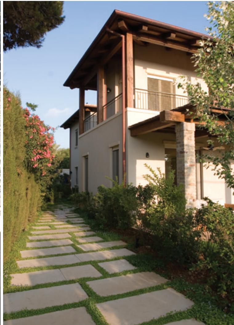
אריח בטון אדריכלי - אדריכלית: קרין קליר