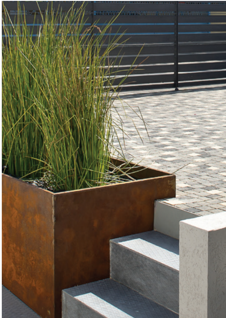
ריצוף דגם 'דמות' בשילוב צבעים - אדריכל: עופר ארז